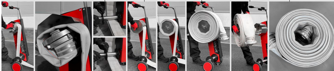
Dokonale souměrně navinutá hadice připravená k uskladnění