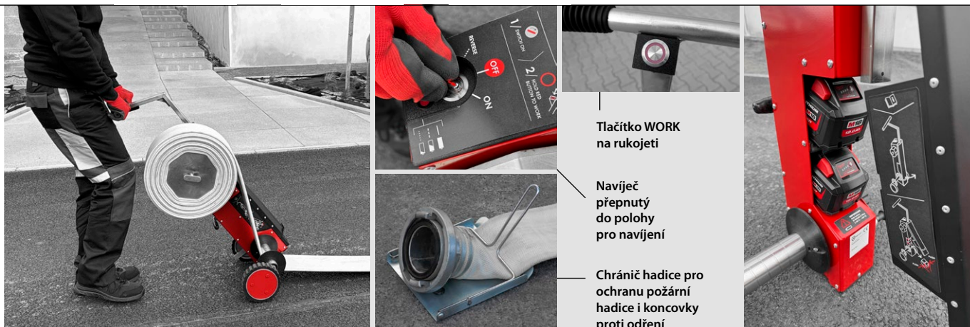
Možnost navíjení za chůze